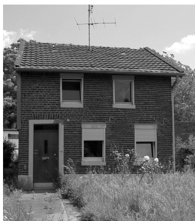
Przykład kompleksowej termomodernizacji budynku mieszkalnego do standardu pasywnego

Głównym celem programu jest zmniejszenie emisji CO 2 oraz pyłów w wyniku poprawy efektywności wykorzystania energii. Realizacja tego celu wpłynie na ograniczenie zjawiska globalnych zmian klimatu jak i poprawę jakości powietrza w Polsce. Programem zostaną wsparte prace remontowe prowadzące do kompleksowej termomodernizacji budynku oraz działania prowadzące do uzyskania oszczędności energii, dzięki